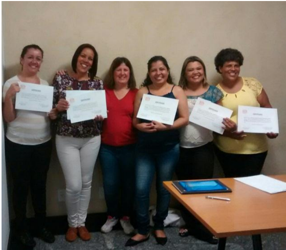
Formandas do Curso. Da esquerda para a direita:

A formação, que já está na sua 14ª edição, visa capacitar o profissional Técnico em Podologia a identificar o pé em risco, proporcionando uma visão crítica ao profissional sobre os cuidados com os portadores de diabetes e aperfeiçoamento do aluno em técnicas apropriadas, as quais são aplicadas em pacientes com diabetes.